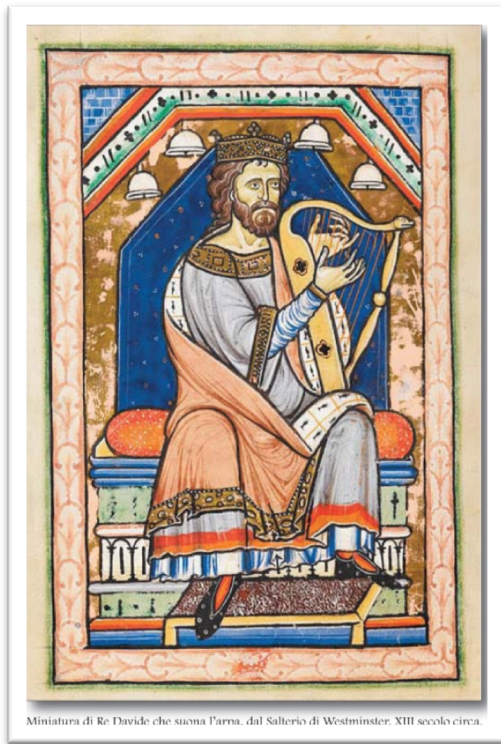
Miniatura di Re Davide che suona l'arpa, dal Salterio di Westminster. XIII secolo circa.